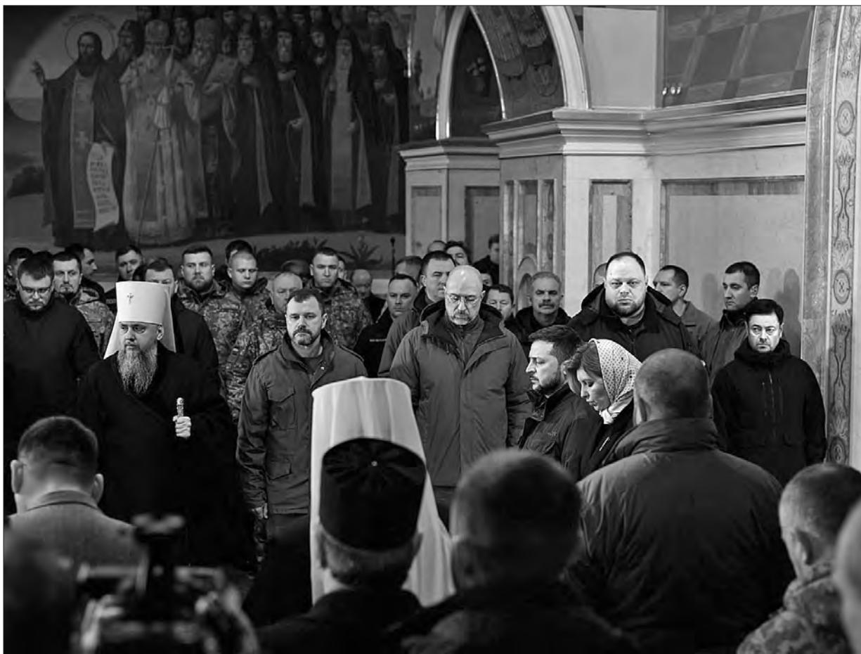
Під час молитовного заходу в Успенському соборі Києво-Печерської лаври.

«І сьогодні ми знаємо, що ніколи не можна пробачати та забувати злочини проти люд-