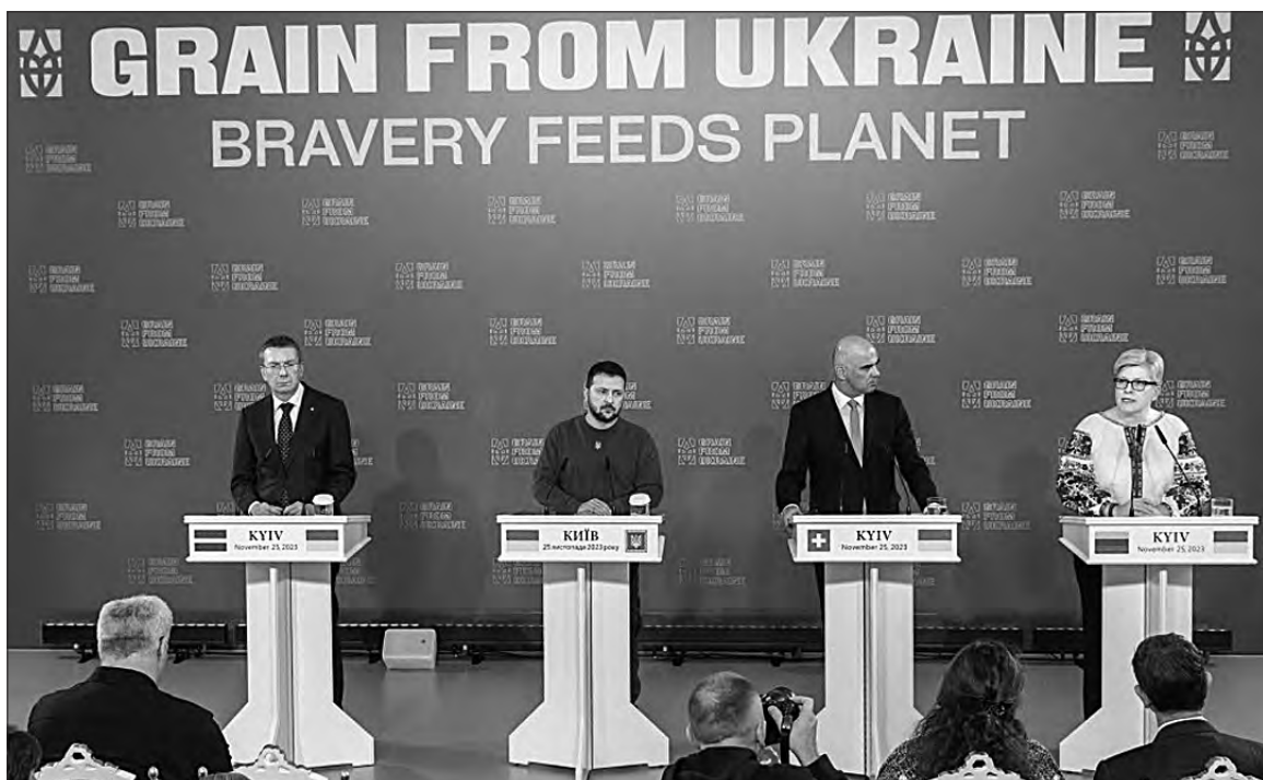
Президенти Латвії, України та Швейцарії Едгарс Рінкевичс, Володимир Зеленський, Ален Берсе та Прем'єр-міністр Литви Інґріда Шимоніте.